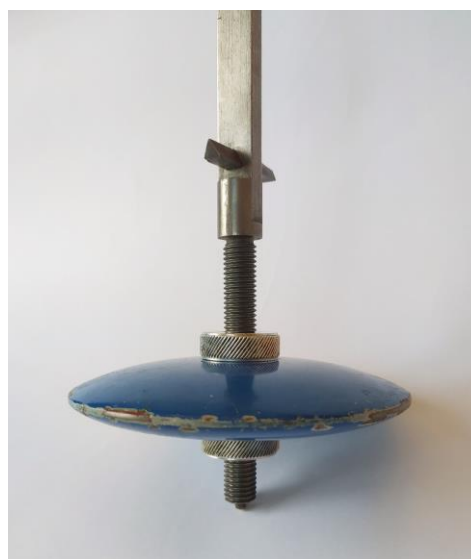
Obr. 2. Detail čochky